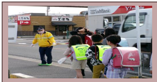
【運動期間中の早朝街頭指導】