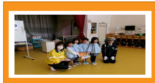
【チャイルドシート着用推進子ども園の指定】