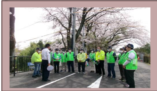
【交通事故死ゼロを目指す日の広報啓発】