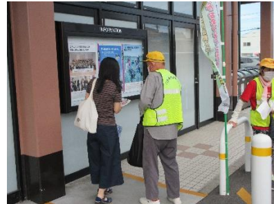
～ 8/17(木) 15:30～ マックスバリュ鈴鹿若松店様における広報活動 ～