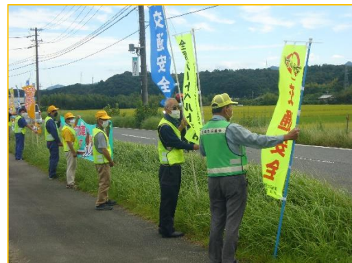
9/21 のぼり旗掲出活動(白山支部)