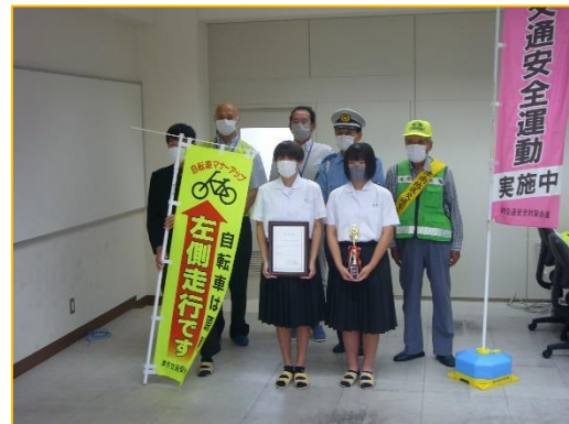
9/28 交通安全パイロット校指定式