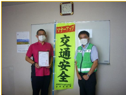
9/21 シートベルト着用推進事業所指定式