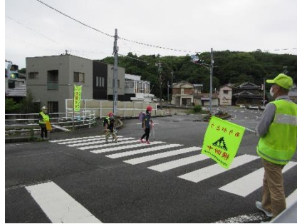
浜島支部早朝街頭指導(浜島)