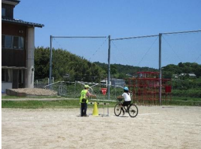
加茂小で自転車交通安全教室(鳥羽)