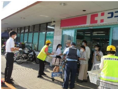
夕焼け小焼けキャンペーン(志摩)