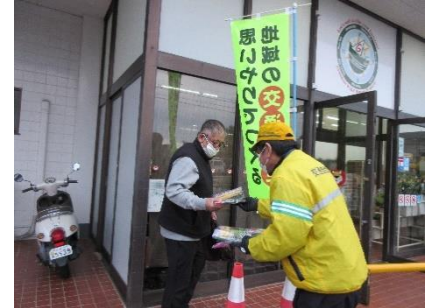
ライトオンキャンペーン(大王)