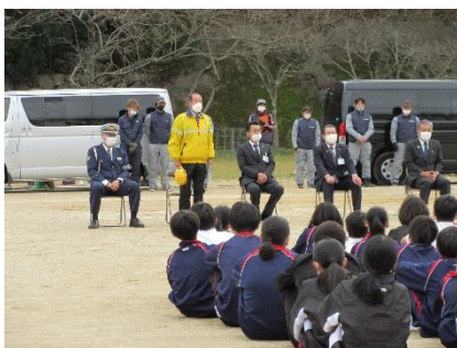
鳥羽東中学校、鳥羽市各小学校合同スタントによる自転車交通安全教室