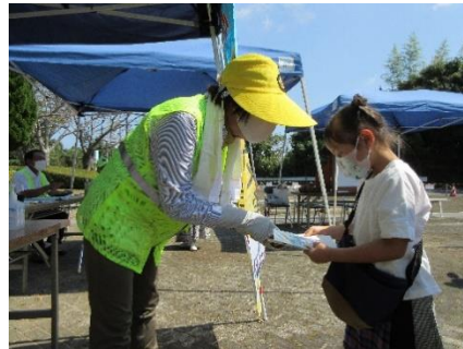
ええじゃんかまつり(阿児)