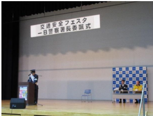
年末の交通安全フェスタと一日警察署長(鳥羽一郎さん)委嘱式