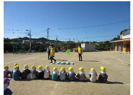
磯部幼稚園交通安全教室(磯部)