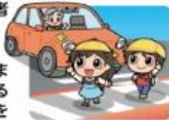
横断歩道は歩行者優先

横断歩道は歩行者優先です。運転者には横断歩道手前での減速義務や停止義務があります。歩行者の横断を妨げないようにしましょう。歩行者や他の車両に対する「思いやり・ゆずり合い」の気持ちを持って運転しましょう。