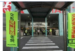
西部ブロック～F マート鈴鹿インター店