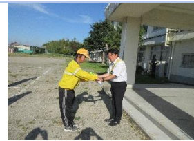
支部長から横断指導旗寄贈