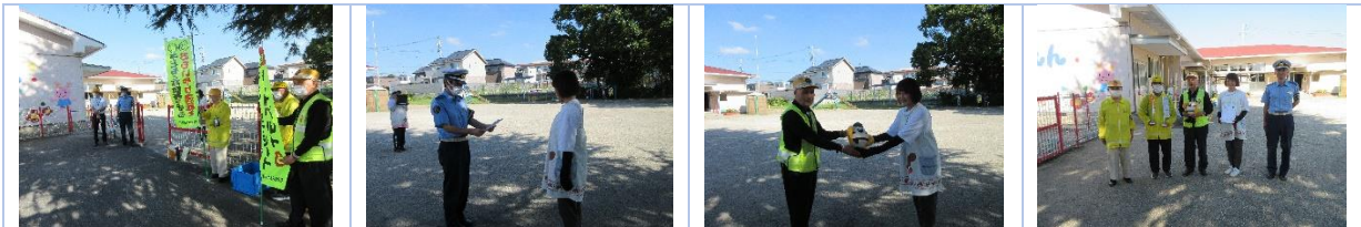
登園時の安全指導