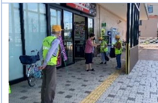
一ノ宮支部～スーパーオークワ高岡店