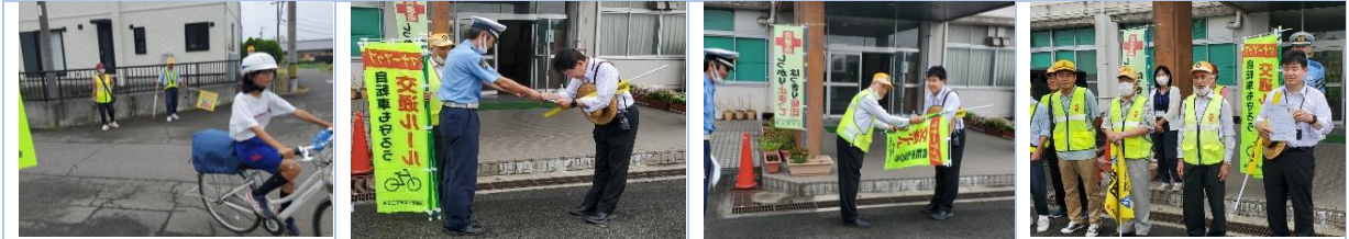
登校時の安全指導