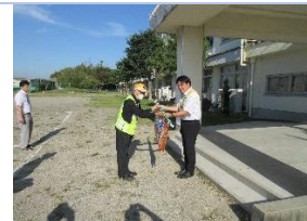
会長から啓発のぼり旗寄贈