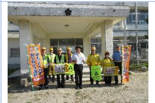
関係者交通安全指導・懇談