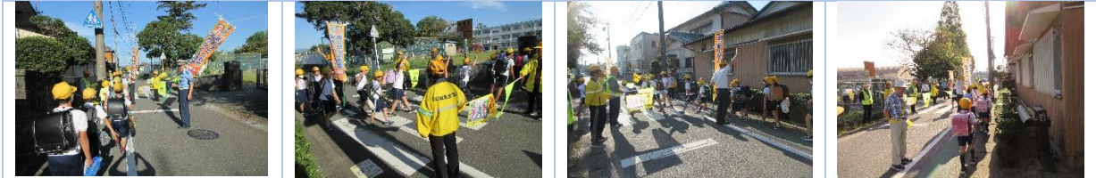
登校時の安全指導