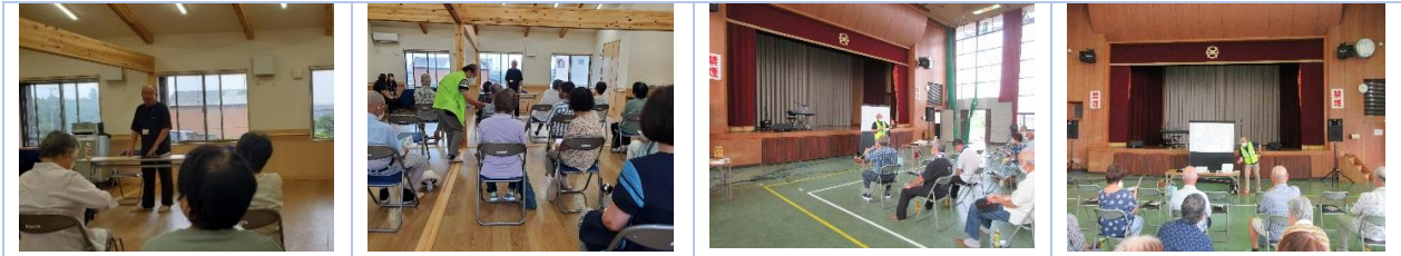
鈴峰支部～9/18 伊船集会所