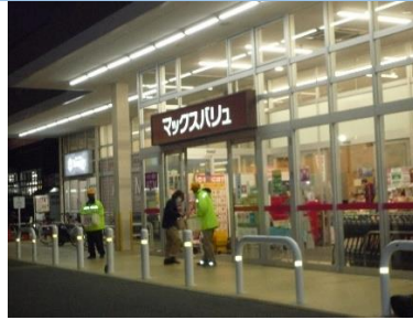
店出入口で啓発物配付