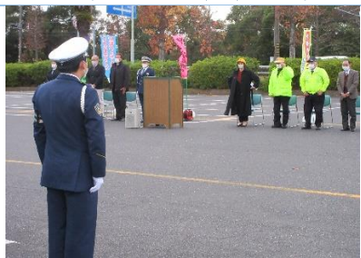
市長・署長出席で出発式開始

○ 11月30日(水) 出発式 鈴鹿サーキット駐車場～交通安全だより No. 23 と重複～