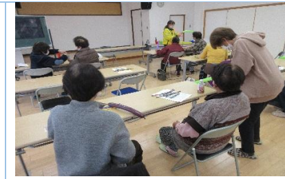
啓発用パルーンアート作成教室