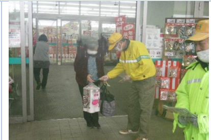
西部支部ブロックによるF マート 鈴鹿インター店前での交通安全・ライト☆オン運動広報啓発活動実施状況