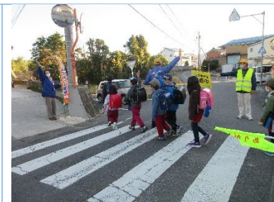
支部長から横断旗寄贈