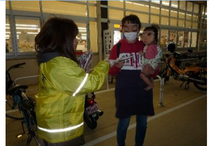
親子連れに反射材を配付