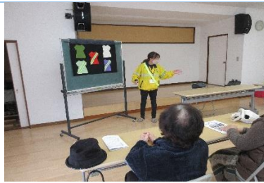
支部長による反射材効果の実証