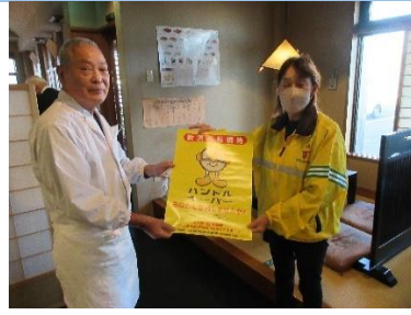
中野支部長から啓発物を配付