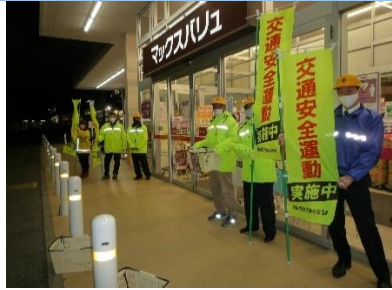
市職員・飯野支部員による広報