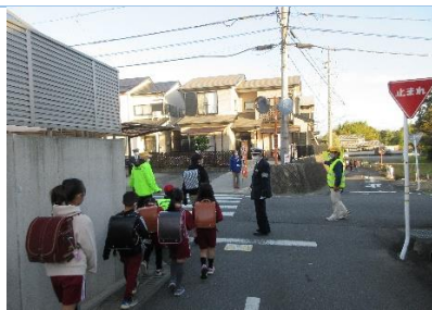
上段：児童の通学路安全指導

○ 12月1日(木) まもってくれてありがとう運動モデル校指定 国府小学校～国府支部～