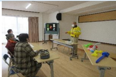
事務局長による交通安全講話