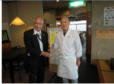
会長から啓発ミニチュア旗寄贈