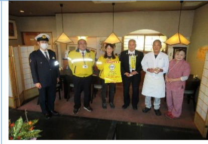
店主らと「飲酒運転ダメ！」宣言