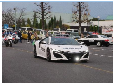
ホンダ NSX 先導で部隊出動

○ 12月1日(木) まもってくれてありがとう運動モデル校指定 国府小学校～国府支部～