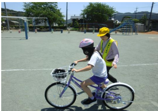
小学生に対する交通安全教室