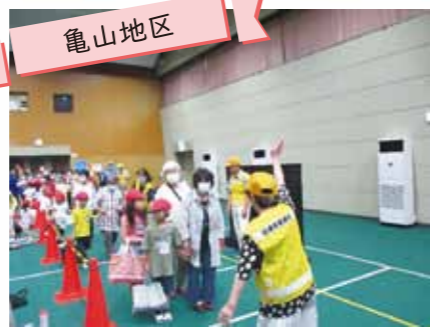
亀山市内にて児童と高齢者を対象に 交通安全教室を行いました。