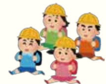
歩行者の皆さんへ

※グリーンベルトは、学校や地域自治会からの要望に応じて道路管理者が設置します。設置基準等は各市町により異なります。