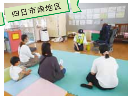
四日市内の保育園にて チャイルドシートの取付け方指導を行いました。