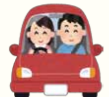
ドライバーの皆さんへ

歩行者の安全を図るために設置してありますが、歩行者専用の通行帯ではありません。車に注意してグリーンベルトの上を通行しましょう。