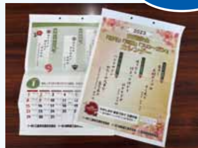
俳句・川柳・スローガン 2024年カレンダー