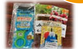
ペットボトルホルダー&オープナー 富士山柄リフレクター・野菜の種