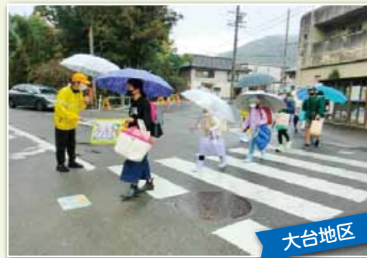
大台内の通学路にて登校時のみまもり活動を行いました。