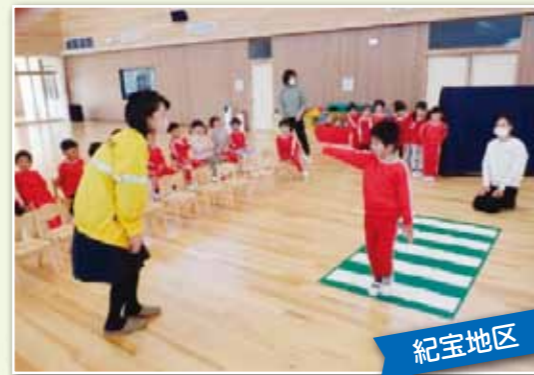
紀宝内の保育園にて交通安全教室を行いました。