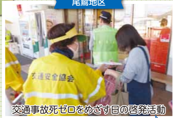
交通事故死ゼロをめざす目の啓発活動