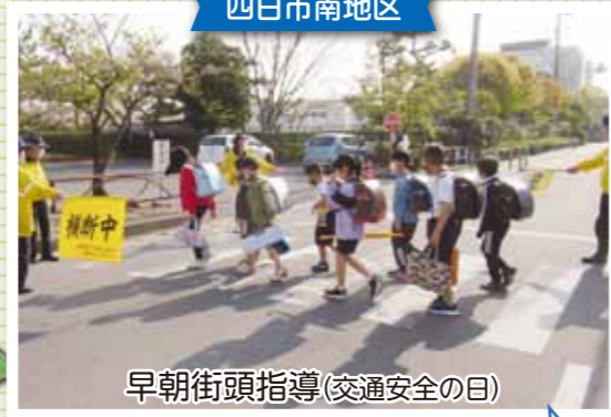
早朝街頭指導(交通安全の日)