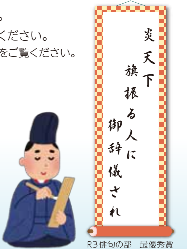
R3俳句の部 最優秀賞