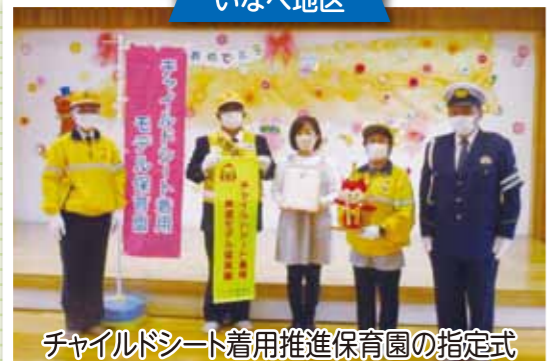
チャイルドシート着用推進保育園の指定式