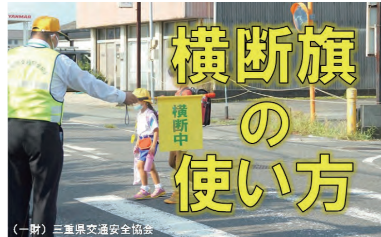
(一財) 三重県交通安全協会