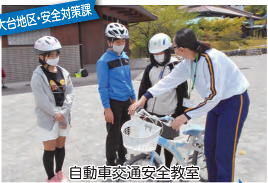
大台地区・安全対策課