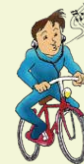
イヤホーンの使用