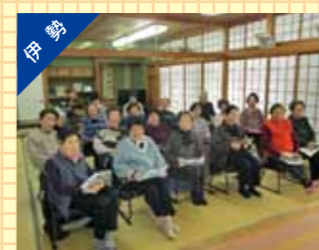
老人会での交通安全講話