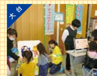
大台町こどもまつりの実施