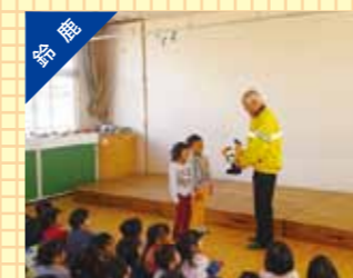
チャイルドシート使用推進モデル保育所の指定式