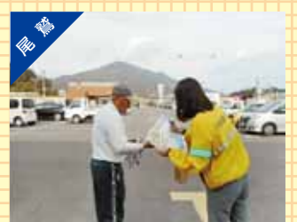
高齢者の交通安全の日の活動