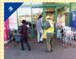
交通事故防止啓発活動