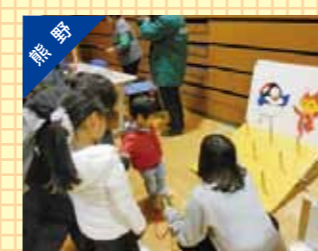
交通安全フェスタの開催