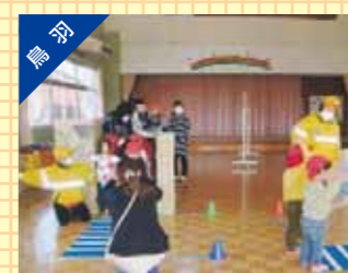
保育園児に対する交通安全教室