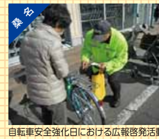
自転車安全強化日における広報啓発活動