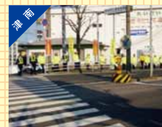
緊急事故防止啓発活動