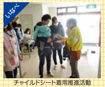
チャイルドシート着用推進活動