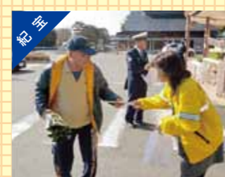
高齢者の交通安全の日の活動