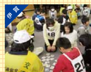
交通安全カルタ大会の開催