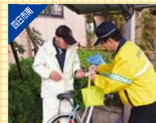
自転車安全対策強化日における広報啓発活動