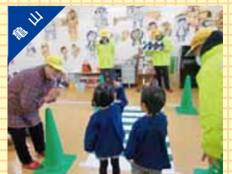
保育園児に対する交通安全教室