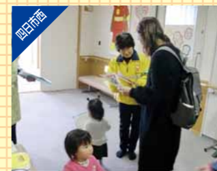
チャイルドシート着用推進活動