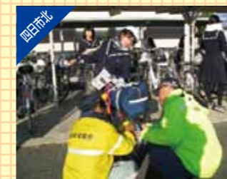
自転車反射材取り付け活動