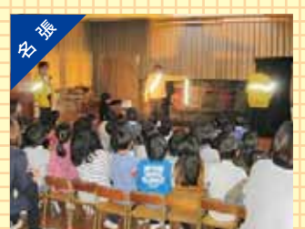
保育園での交通安全教室