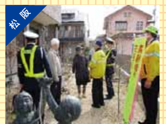
高齢者宅訪問活動