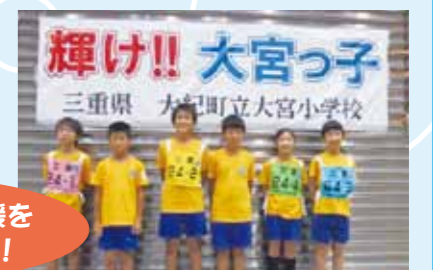
昨年の三重県代表チーム