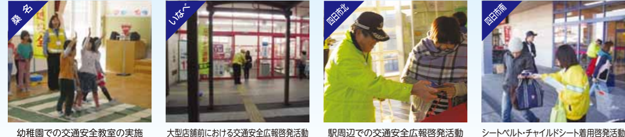
幼稚園での交通安全教室の実施、大型店舗前における交通安全広報啓発活動、駅周辺での交通安全広報啓発活動、シートベルト・チャイルドシート着用啓発活動