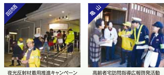
夜光反射材着用推進キャンペーン、高齢者宅訪問指導広報啓発活動