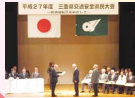
受賞された皆様、おめでとうございます。