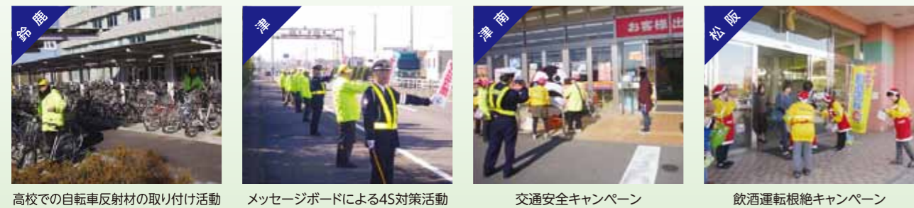
高校での自転車反射材の取り付け活動、メッセージボードによる4S対策活動、交通安全キャンペーン、飲酒運転根絶キャンペーン