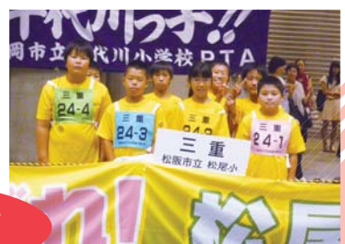
昨年の三重県代表チーム