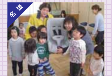
「チャイルドシート着用推進モデル保育所」指定式