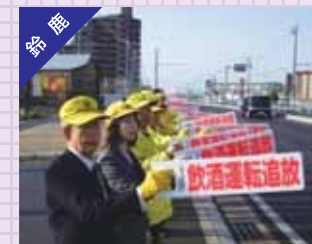
早朝ミルミルウェブで事故防止啓発