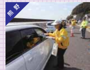
飲酒追放キャンペーンの実施