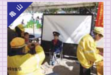
亀山城桜まつり会場で「子ども交通安全約束免許証」を発行