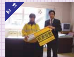
小学校へ横断旗の贈呈