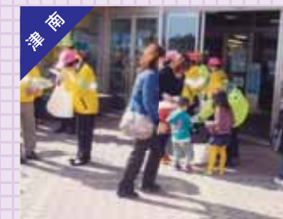
飲酒運転根絶・全席シートベルト着用キャンペーン