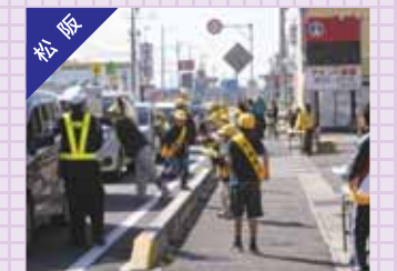
子供会による街頭啓発キャンペーン