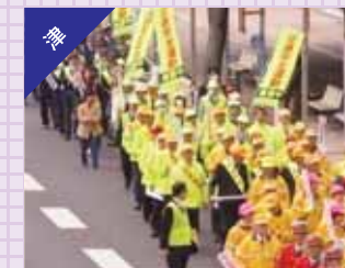
春の全国交通安全運動に伴う交通安全パレード