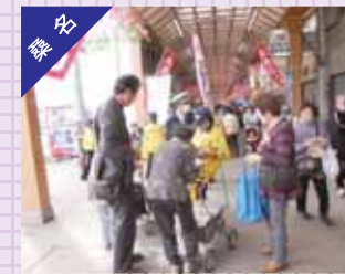
三八朝市にて事故防止呼びかけ