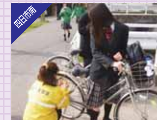
生徒全員に自転車点検で事故防止を再確認