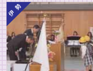
小学校入学式において黄色の帽子・ヘルメット等の贈呈