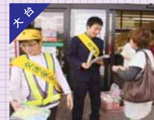
中学校生徒参加の啓発キャンペーン