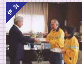
新入学児童に交通安全グッズの贈呈