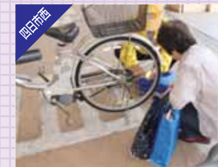
反射材のない自転車に一台づつフレクター取付け