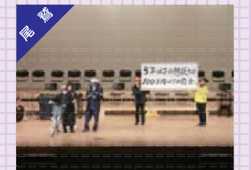
交通安全と吹奏楽の集い