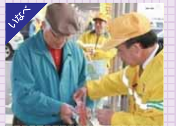
反射リストバンドを配布して交通安全啓発