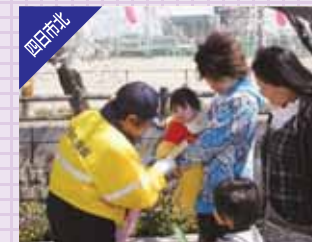
「海蔵川・十四川桜まつり」の会場で啓発活動