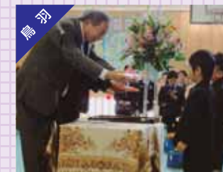
新入学児童に黄色い傘の贈呈