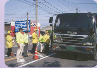
安全運動で飲酒運転根絶キャンペーン(鈴鹿地区交通安全協会)