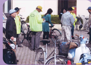
SBデーに自転車無料点検を実施(名張地区交通安全協会)