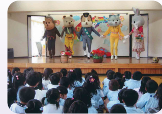
女性部が園児に寸劇で交通安全教室(四日市北地区交通安全協会)