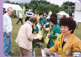
「つつしまつり」で飲酒運転追放署名活動(伊賀地区交通安全協会)