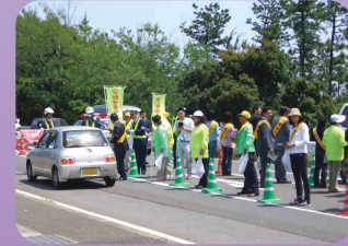
安全運動で交通安全キャンペーン(紀宝地区交通安全協会)