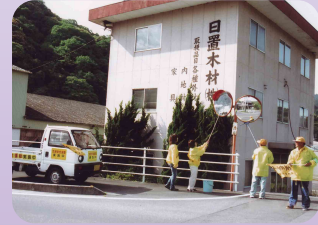
安全運動にカープミラーの清掃奉仕活動(津南地区交通安全協会)