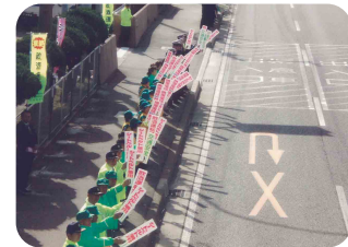
安全運動期間中の早朝、ミルミルウェーブ(桑名地区交通安全協会)

発行所 財団法人 三重県交通安全協会 三重県交通安全活動推進センター(三重県公安委員会指定) 〒514-0004 津市栄町1-954 三重県栄町庁舎5F TEL 059-228-9636 URL http://www.mie-ankyoo.com