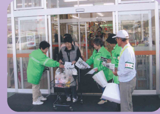
大型店舗で啓発物を配布(伊勢地区交通安全協会)