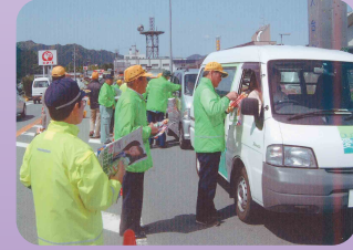
安全運動で国道通行のドライバーに啓発物(大台地区交通安全協会)