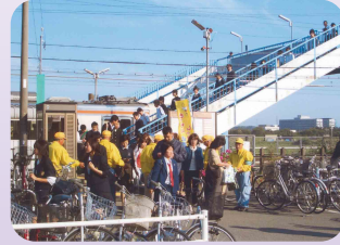
SBデーに井田川駅前街頭広報啓発(亀山地区交通安全協会)