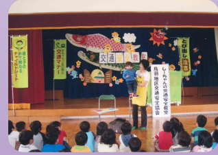
腹話術で幼稚園児に交通安全教室(鳥羽地区交通安全協会)