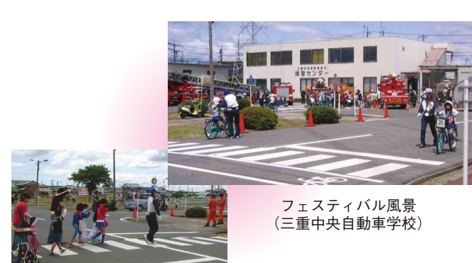
フェスティバル風景(三重中央自動車学校)

三重中央自動車学校は、高茶屋地区交通安全フェスティバル実行委員会と協力して5月20日、津市高茶屋の三重中央自動車学校を一日開放し、「第七回高茶屋地区交通安全フェスティバル」を開き、800人余りの地区住民が参加し、安全対策部の交通安全協会アドバイザーらによる自転車走行指導やシミュレーターを使用したの運転反応検査、模擬店、警察音楽隊の演奏などを楽しみました。