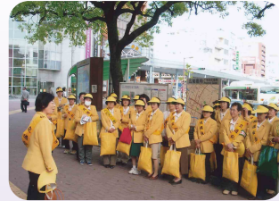
女性部は安全運動で街頭啓発活動(四日市南地区交通安全協会)