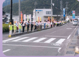
安全運動でミルミルウェーブを実施(尾鷲地区交通安全協会)