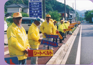
安全運動で国道でミルミルウェーブ(熊野地区交通安全協会)