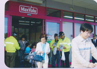
大型店舗前で「飲酒運転追放」の広報啓発活動(四日市西地区交通安全協会)