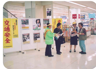
大型店舗でミニフェスティバルを開催(いなべ地区交通安全協会)