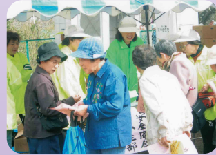
女性部が「なめり湖桜まつり」で花見客に啓発物(松阪地区交通安全協会)